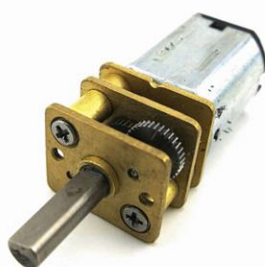
图 3 电动机外观（供参考）